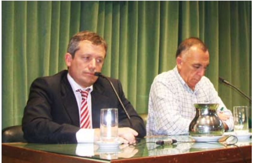
El ministro bonaerense respondió con interés los reclamos de los delegados en el consejo de diciembre

El pasado 19 de diciembre fue inaugurada la nueva sede de la rural de Villegas que apunta a convertirse en una Casa del Campo. (Ver imágenes en galería de fotos)