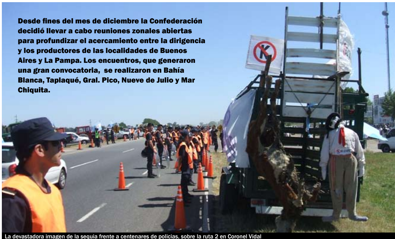
La devastadora imagen de la sequía frente a centenares de policías, sobre la ruta 2 en Coronel Vidal

Desde fines del mes de diciembre la Confederación decidió llevar a cabo reuniones zonales abiertas para profundizar el acercamiento entre la dirigencia y los productores de las localidades de Buenos Aires y La Pampa. Los encuentros, que generaron una gran convocatoria, se realizaron en Bahía Blanca, Taplaqué, Gral. Pico, Nueve de Julio y Mar Chiquita.