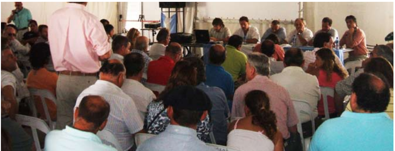
Zonal abierta en la localidad de Tapalqué

En la ciudad de Tapalqué la zonal se realizó el día viernes nueve de enero y