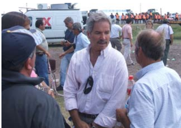
Felipe Solá, uno de los referentes políticos presentes en Mar Chiquita