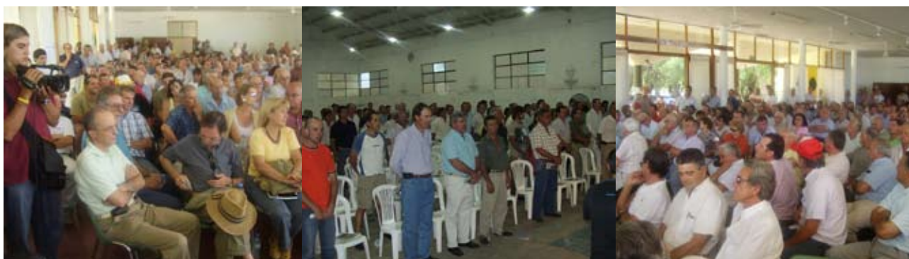
Gran concurrencia de asistentes a las reuniones zonales abiertas que se realizaron en Gral. Pico y Nueve de Julio