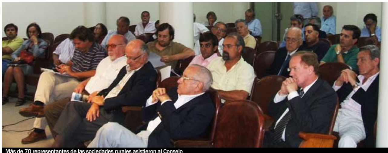
Más de 70 representantes de las sociedades rurales asistieron al Consejo